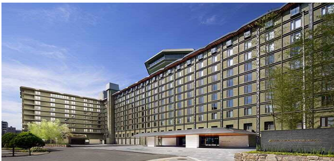
リーガロイヤルホテル京都

Y ツアーズ株式会社 京都支店 〒604-8241 京都市中京区三条通新町西入ル釜座町 22 ストークビル三条烏丸 409 TEL : 075-746-2913 FAX : 075-746-2914 E-mail:kyoto@ytours.jp 営業時間 9 : 00 ~ 18 : 00 (土・日・祝日休み)