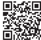
申込用 QR コード

お申込み締切日前でも定員になり次第、参加・宿泊締切りとなります。ご了承ください。